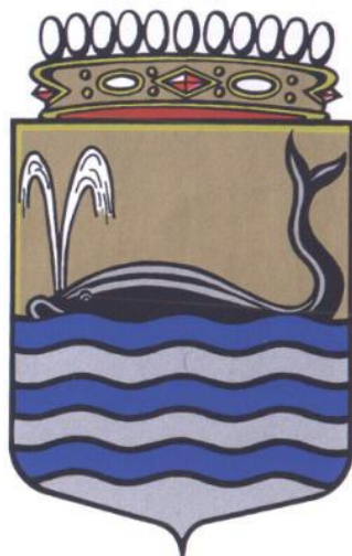
Wapen van Walcheren.